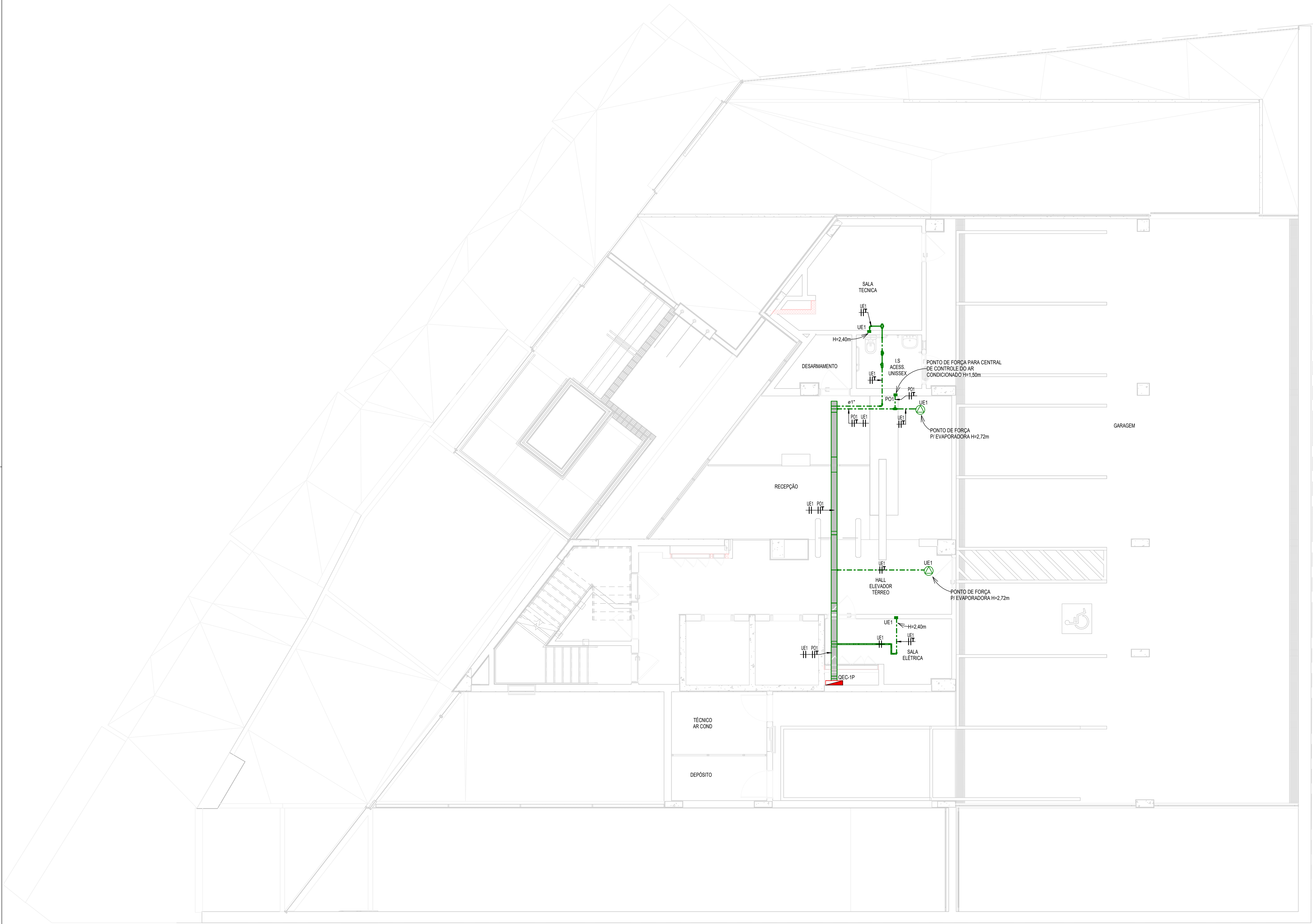
1º PAVIMENTO - ALIMENTAÇÃO EVAPORADORAS 1 : 75